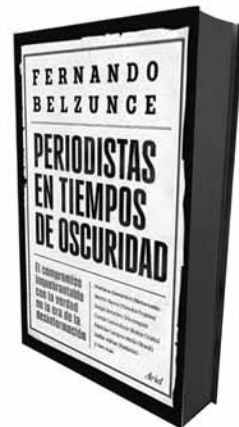
Periodistas en tiempos de oscuridad

Muchas personas perciben una merma de sus espacios de seguridad, sobre todo en las generaciones más jóvenes. Como consecuencia, la demanda de contrapoder natural a la función propia del periodismo va mutando hacia la exigencia de un periodismo acoplado al poder, a algún poder, a alguna parcela de poder; bien a un poder en ejercicio o a un poder que se presenta como alternativa. Una parte de la ciudadanía concibe ahora el periodismo como una herramienta subordina-