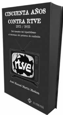
Cincuenta años contra RTVE (1975/2025). Del desastre del bipartidismo al decretazo del gobierno de coalición José Manuel Martín Medem Ediciones El Boletín / 12 €

secuencia de esto, en ella aparece el logo de RTVE anterior a 2008 partido en pedazos.